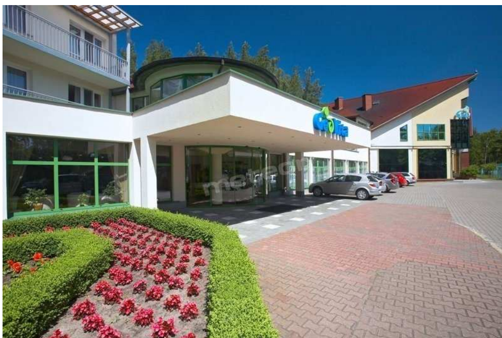
Zdjęcie 1 - Centrum Szkoleń i Konferencji Geovita w Dąbkach

Centrum Zdrowia i Rekreacji GEOVITA zlokalizowane jest w Dąbkach (76-156), przy ul. Letniskowej 4.